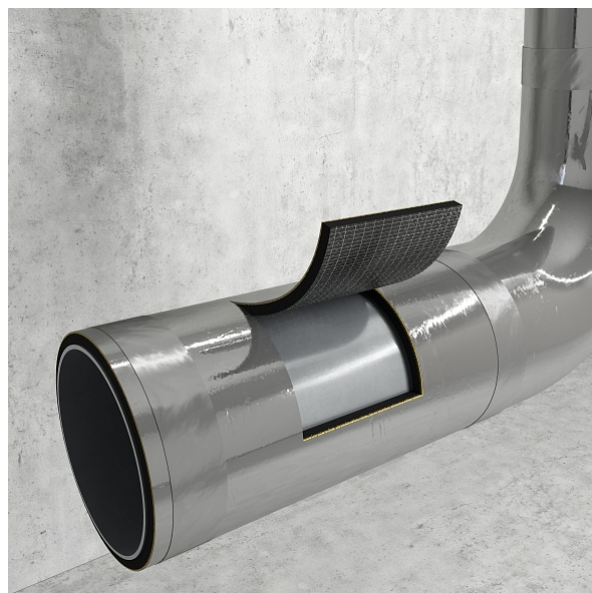
Система звукоизоляции труб Стандарт